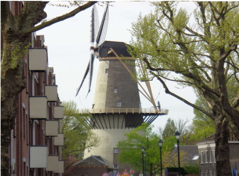
'Molen De Drie Koornbloemen'