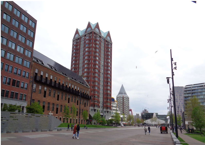
Rotterdam Blaak – de Binnenrotte