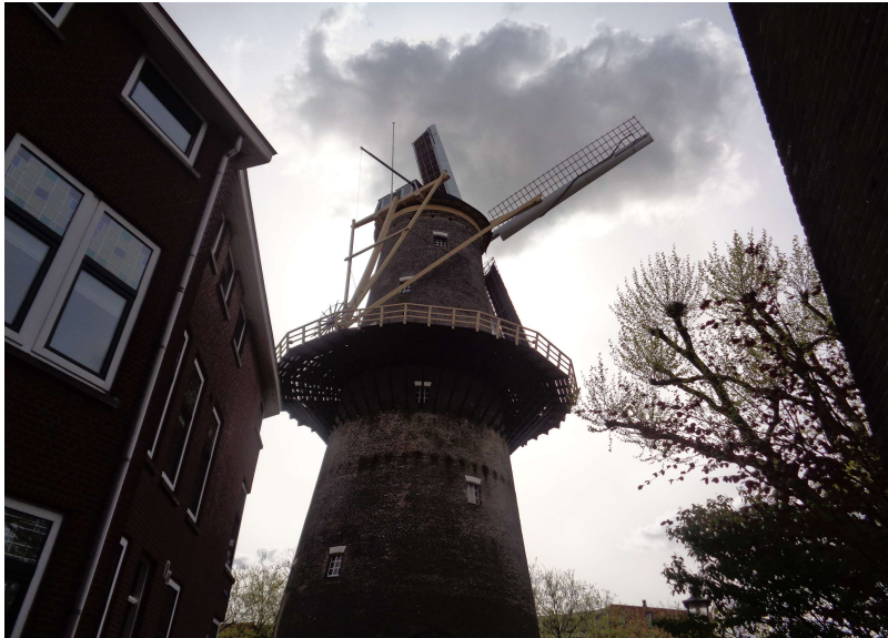
Molen 'De Walvisch'