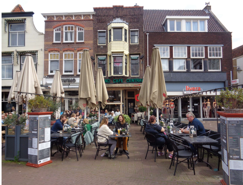
Markt Gouda – Cafés