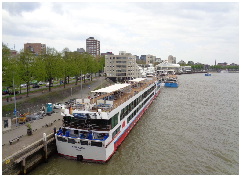
Rotterdam – Zicht op de binnenvaart