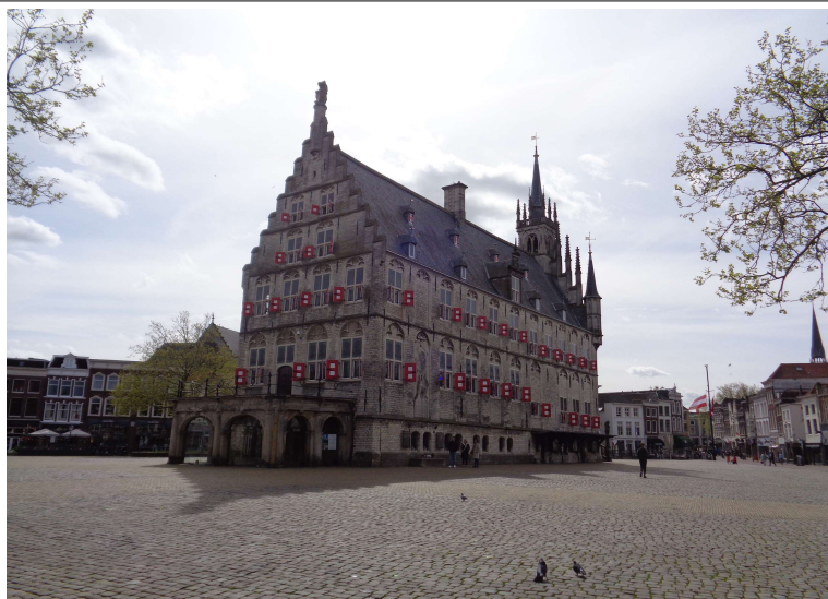
Markt Gouda met het oude stadhuis