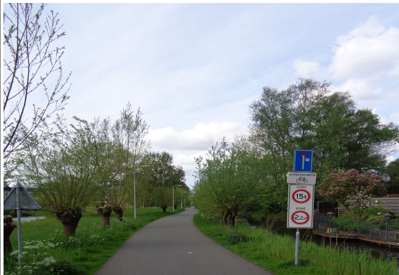
Gouda – 'Voorwillenseweg'

om uiteindelijk op de Goverwellesingel uit te komen. Een avontuur op zich maar toch een uitdaging!