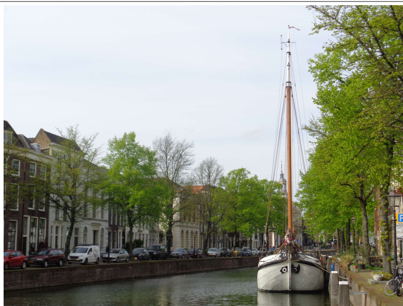
Schiedam – 'Lange Haven'