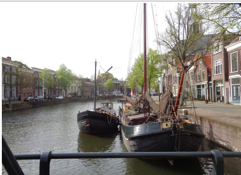
Schiedam – 'Lange Haven'